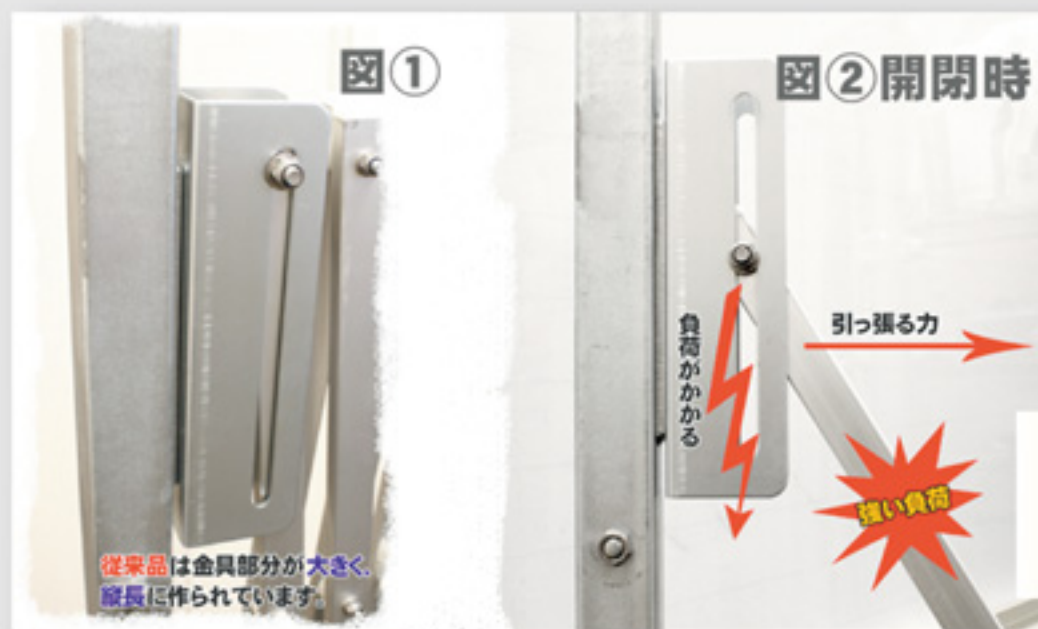
図2のように開閉時に引っ張る力と金具部分の矢印(力の加わり方)が違うためクロス材(柱)に強い負荷がかかり折れてしまうことが多い。