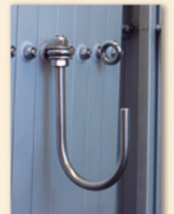
EXG12・15タイプはオプション