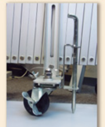
全タイプオプション